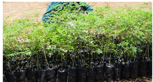
Fig 1: Mimera ya muti wa muringa ibangitwo. Uyu ti mugango mwega

Mbicha ino ironania njira mithemba cia kubanga itanda ciaku ta uria twaririria haha iguru.