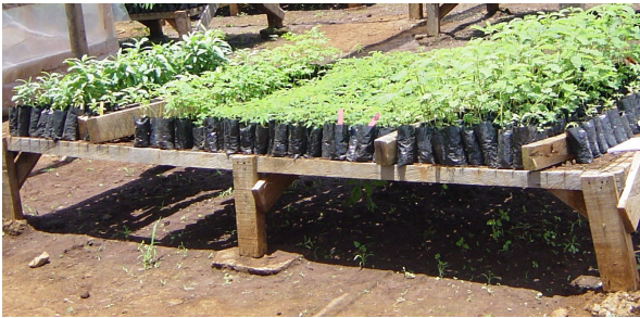
Fig 2: Mimera ya miti ya mithemba ihanditwo itandaini cirri iguru.

kurigiriria uu, niwega mundu kuhanda mimera yake tuchubaini tukunure nathu na thutha utuige itandaini icio ciambatitio. (Mbicha ya Keri). Gitanda giki no githondekwo na mbao hamwe na wire. Uu niwegatundu thutha wa miri gukinya rungu rwa mumera in kugua iguaga na kogwo miri ndi tihagio. Miri ino ni igiaga na hinya hatari gukura makiria. Mumera waku ukoragwo uri na hinya na kogwo orona gukura mugundaini noguo ari raithi. Orohamwe ni ihuthagia wira wa gucheha miri namumera ndutihagio. Gucheha miri ino nikuriganagirwo maita maingi na kana gugekwo thutha makiria. Kurimira oronakuo no kwa raithi.